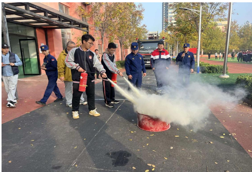
图 10 校园安全消防演练

在基础设施建设与维护方面，持续加大校园基础设施投入，不断改善办学条件。近年来，先后对教学楼、实训楼、宿舍楼、食堂等场所进行升级改造，完善教学实训设施设备，提升校园信息化水平，确保教学实训工作顺利开展。建立健全校园设施日常维护机制，成立专门的维修保障队伍，实行 24 小时值班制度，及时响应师生维修需求，保障校园水、电、气、暖等基础设施正常运行。