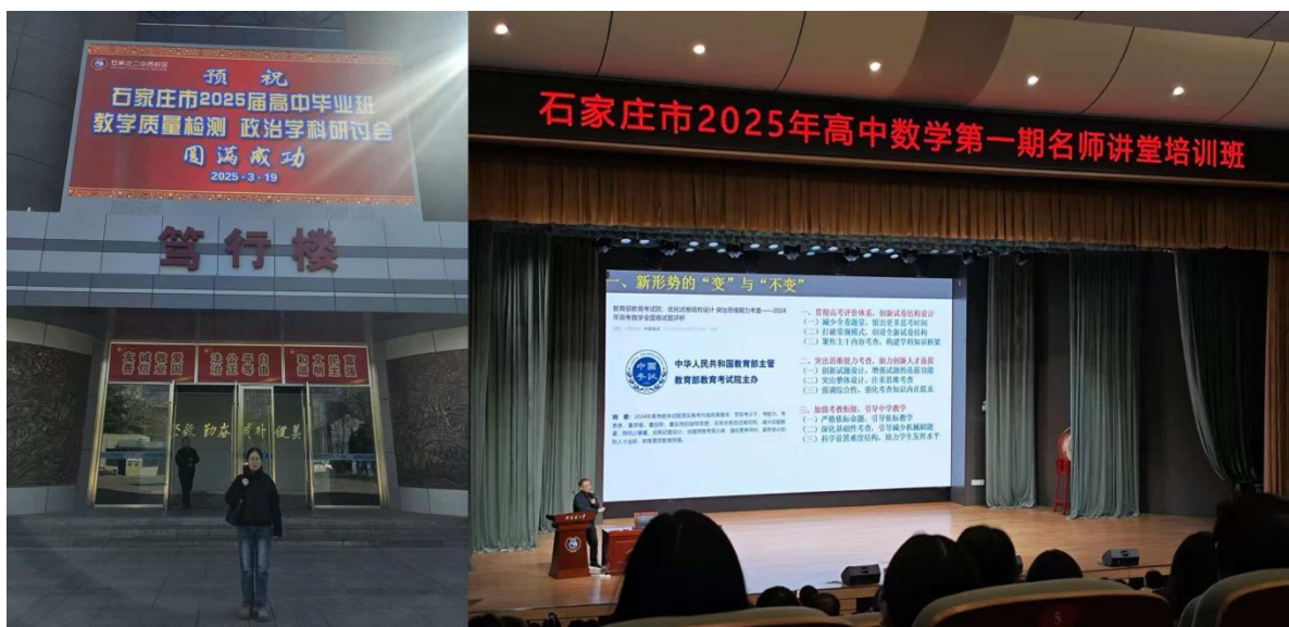
图 6 教师赴优质学校开展学习研讨活动

派各学科骨干教师共 18 人，赴石家庄第二中学参加教学质量检测学科研讨会。参会教师结合自身教学实际，梳理总结学习成果，回校后组织开展校内二次培训，将所学的先进经验与教学方法传递给每一位教师，并应用于日常教学与质量检测工作中，有效提升了学校各学科教学质量检测的科学性与规范性，推动了学科教学改革的深入开展。此次校际教研交流，为教师搭建了学习借鉴、共同提升的平台，进一步提升了教师的专业素养与教学能力，为学校教育教学质量的持续提升注入了新的活力。