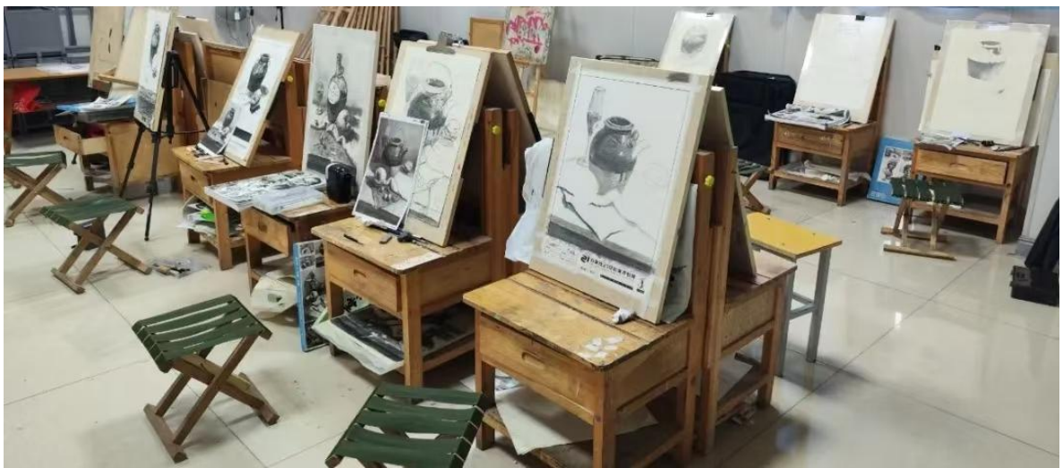
图3 绘画专业学生作品

学校紧密结合当地产业发展需求，优化专业设置，专业设置与当地产业吻合度较高。同时，学校建设专业动态调整机制，优化各专业的布局 and 结构，提高专业建设水平和人才培养水平。学校紧贴社会需求设置专业，开设了美术绘画、音乐表演和舞蹈表演专业。