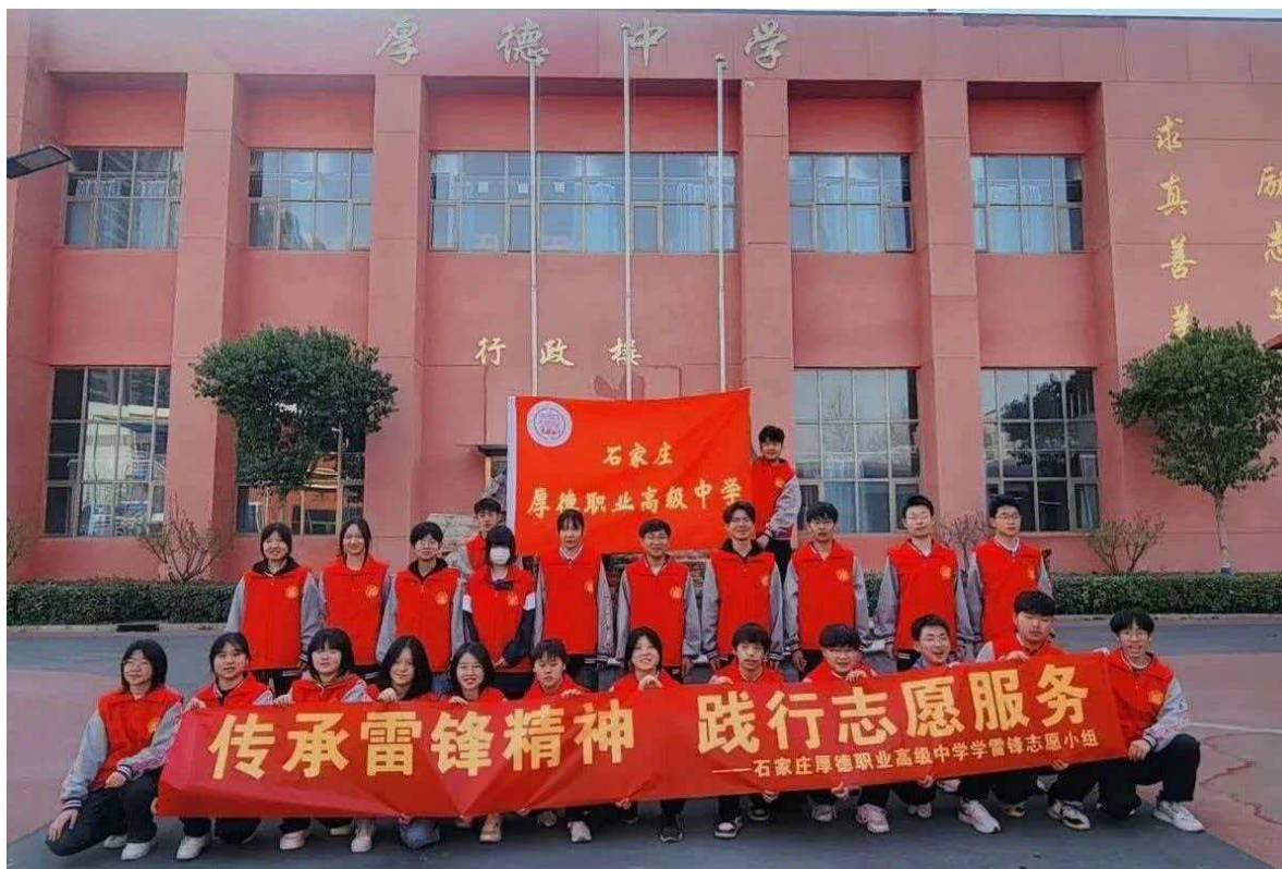
图7 学雷锋志愿服务活动

未来，学校将持续深化志愿服务工作，进一步整合资源、优化队伍、创新载体，推动志愿服务专业化、常态化、品牌化发展，让志愿服务成为职业教育育人的鲜明特色，为服务地方发展、构建和谐社会贡献更大力量。