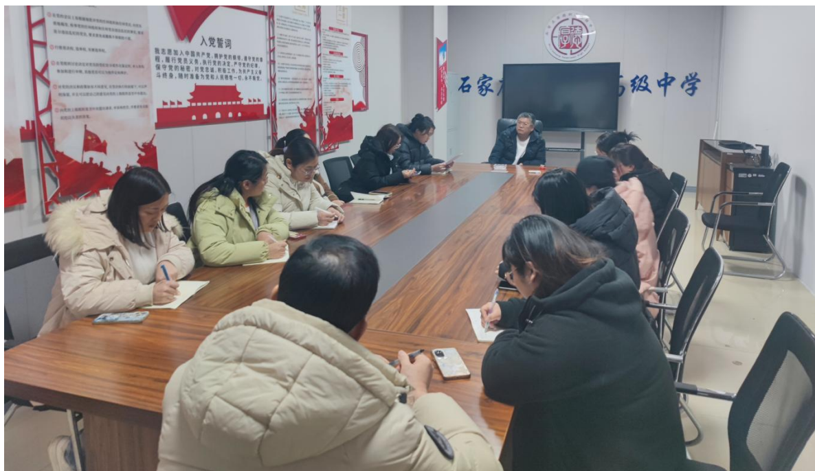
图9 教职工代表大会会议

推进以教职工代表大会为主体的民主监督体系建设，加强教代会、学代会、群团组织建设。教代会定期召开会议，审议学校工作报告、财务报告、工会工作报告等，对学校重大决策和涉及教职工切身利益的事项进行讨论和表决，充分发挥了教职工的民主管理和监督作用。学代会积极参与学校学生事务管理，为学生发声，维护学生权益。群团组织如工会、共青团等积极开展各类活动，丰富师生课余生活，增强学校凝聚力。