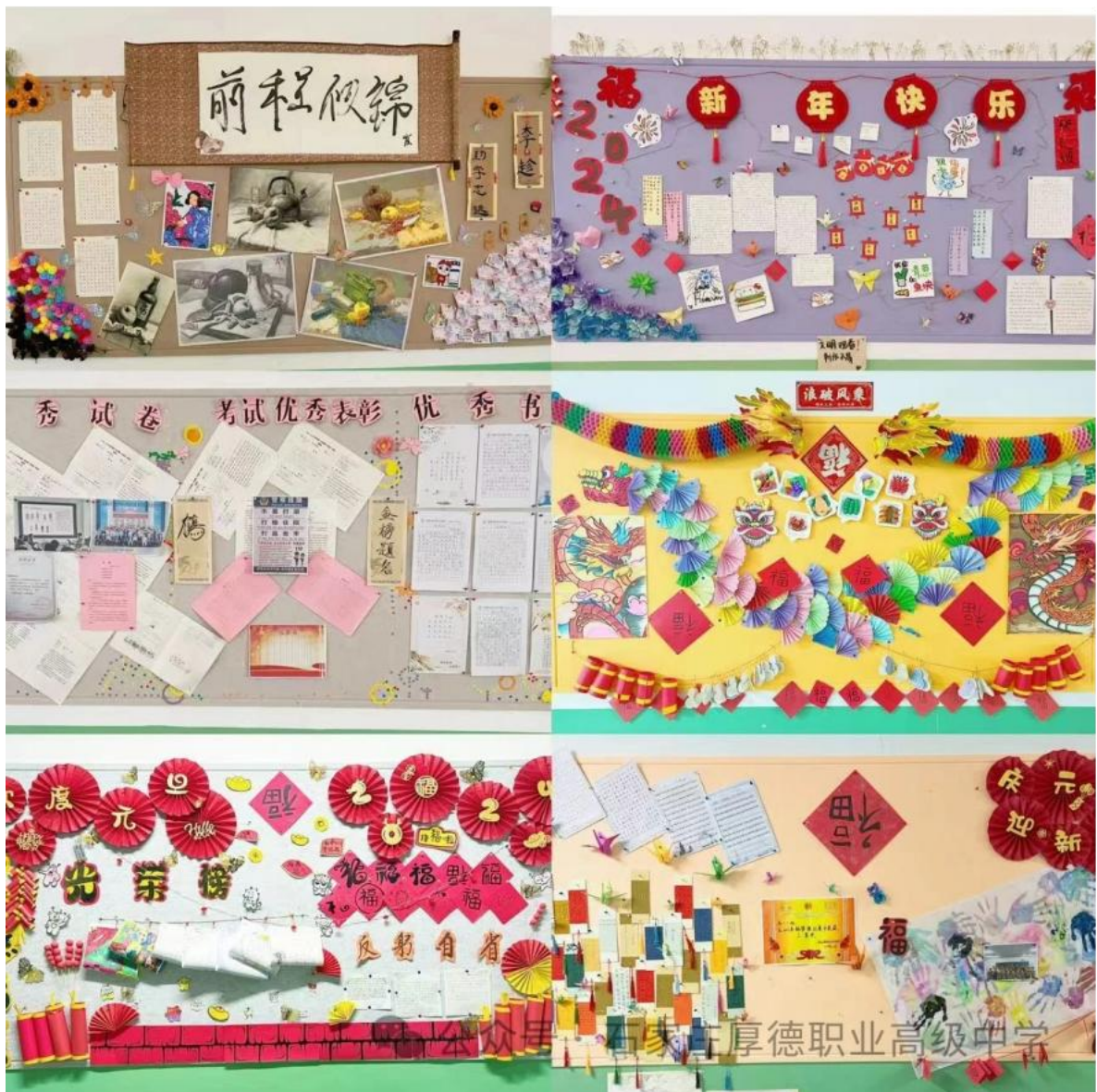
图 8 校园文化展览

承文化的浓厚氛围。校园文化建设成效显著，校园环境优美，文化氛围浓厚。文明风采活动、社团活动、团组织学生会建设及活动等有序开展，让学生在实践过活动的过程中，了解我国优秀的传统文化。