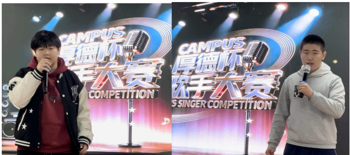
图1 校园歌手大赛活动

习惯，引导学生养成文明礼貌、遵纪守法的良好品质；三是开展“志愿服务暖心”活动，组建“青年志愿者服务队”，组织学生深入社区开展环境整治等志愿服务，增强学生社会责任感；四是开展“心理健康护航”活动，建设标准化心理辅导室，配备2名专职心理教师，开展心理健康普查，为有需求的学生提供个体辅导，帮助学生缓解学习生活压力，塑造健康人格。加强班主任队伍专业化建设，组织班主任参加国家级、省级、市级培训，开展校内班主任工作经验交流会4场，评选优秀班主任5名，提升班主任育人能力。通过系列德育举措，形成了风清气正、积极向上的校园风气。五是开展“文体文艺浸润”活动，以丰富学生精神文化生活、提升综合素养为目标，举办系列文体文艺活动，如校园运动会、文艺汇演、歌手大赛等5余场；组建篮球社、绘画社、象棋社、影视欣赏社等文体类社团6个，定期开展训练和展演活动，培养学生兴趣爱好，增强团队协作意识。